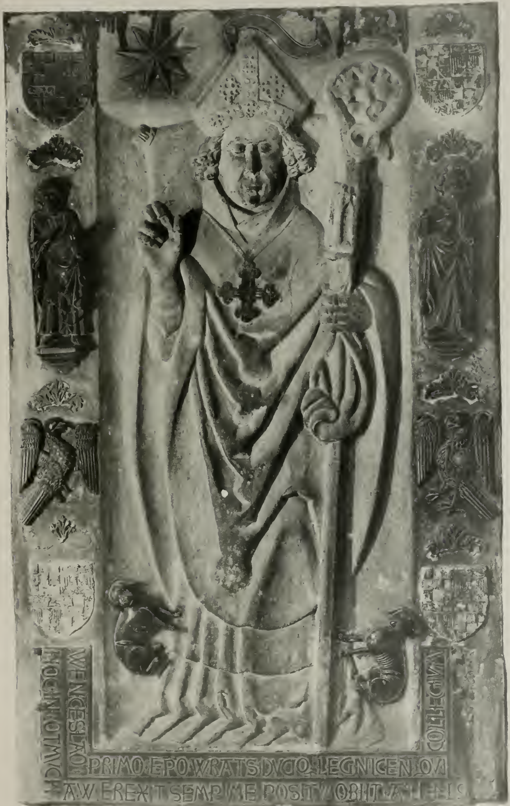
Wenzel. (Tafel 3.)